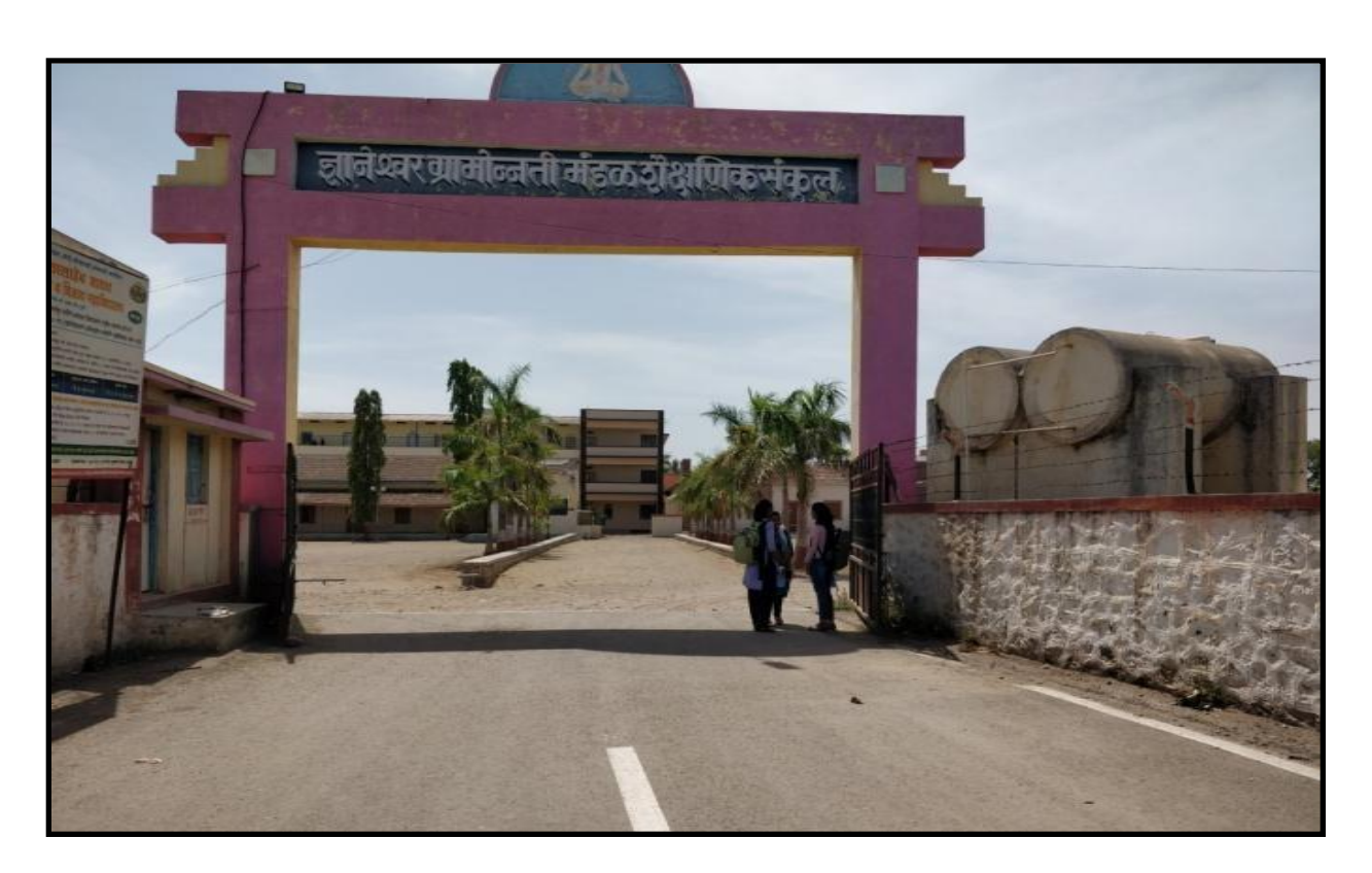
Both Entries in to college are protected by Iron Gate.