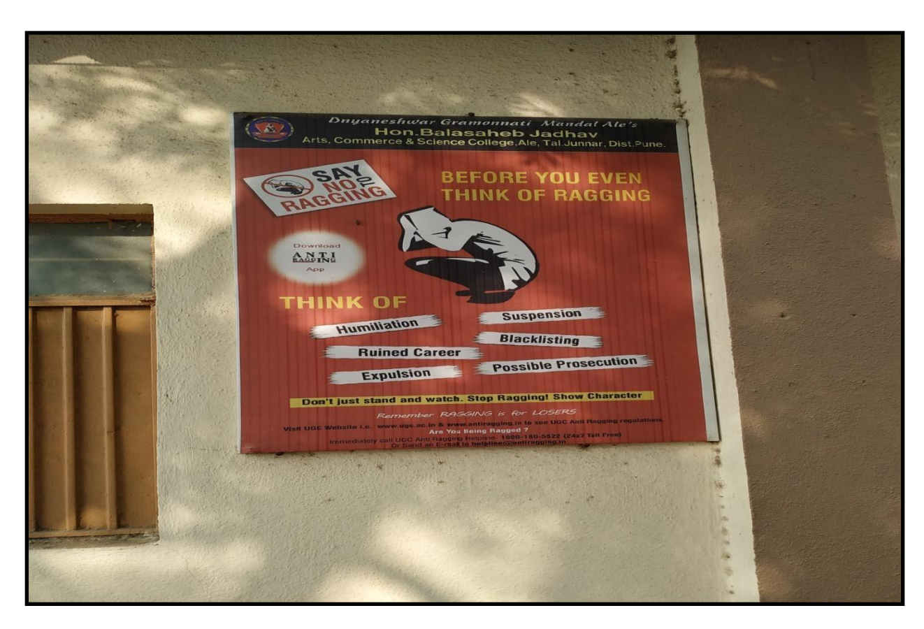
Board is showing that "Ragging" is banned in college campus